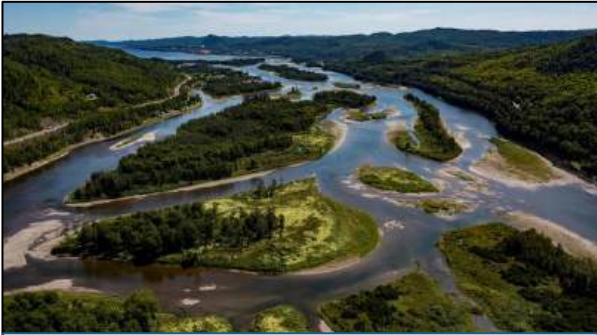
Zec Rivière Petite Cascapédia À 10 minutes