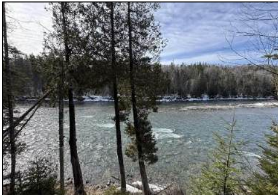
Domaine des Chutes du Ruisseau Creux À 40 minutes