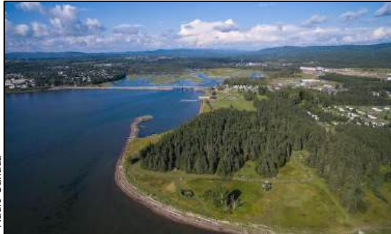
Parc de la Pointe-Taylor À 17 minutes