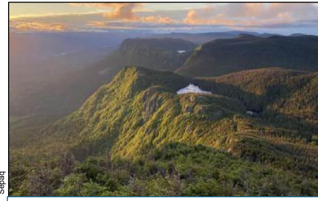
Parc national de la Gaspésie À 1 heure 30 minutes