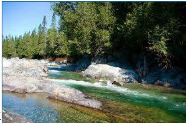
Réserve faunique de Port-Daniel À 1 heure 30 minutes