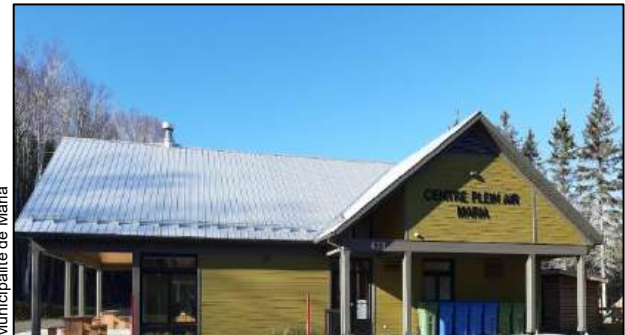
Centre plein air Maria À 30 minutes