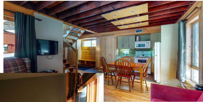
Groupe Explora Terra